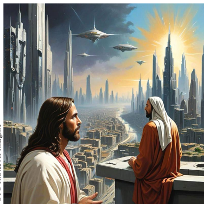
3000 AD. „Mācekļi Viņam vaicāja (30.AD): kā tad rakstu mācītāji saka, ka Ēlijam jānākot papriekš? Uz ko Jēzus atbildēja: Ēlija gan nāk un visu atkal sataisis.“ (Mt.17:10-11).