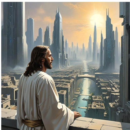
3000 AD. „Otrreizējā Atnākšana“.