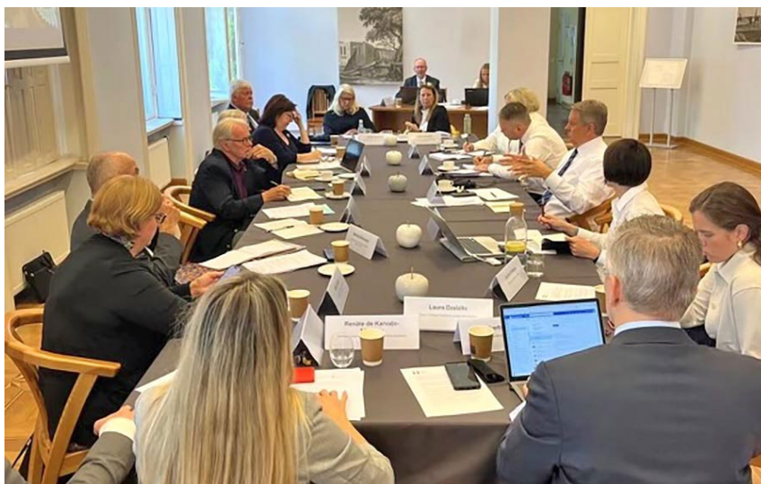
PBLA sēde LU bibliotēkas telpās.