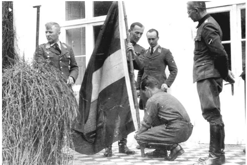
Veselības atjaunošanas rotas virsnieku grupa pēc Vācijas kapitulācijas 1945. gada 6. maijā uzvelk Latvijas karogu.

pārdzīvojumiem no Dancigas telpas ielenkuma deviņiem 15. divīzijas rezerves bataljona karavīriem 7. maijā laimējās sasniegt Kopenhāģenu. Šie karavīri pat kādu laiku bija dzīvojuši kopā ar Štuthofas koncentrācijas nometnē ieslodzītajiem, kuru bijis vēl daži tūkstoši, starp tiem arī daži desmiti latviešu. 3. maijā viņiem no turienes bija izdevies izbēgt.