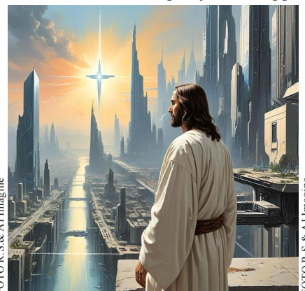
3000 AD. „Bet vai Cilvēka Dēls, kad Tas nāks, atradīs ticību virs zemes?“