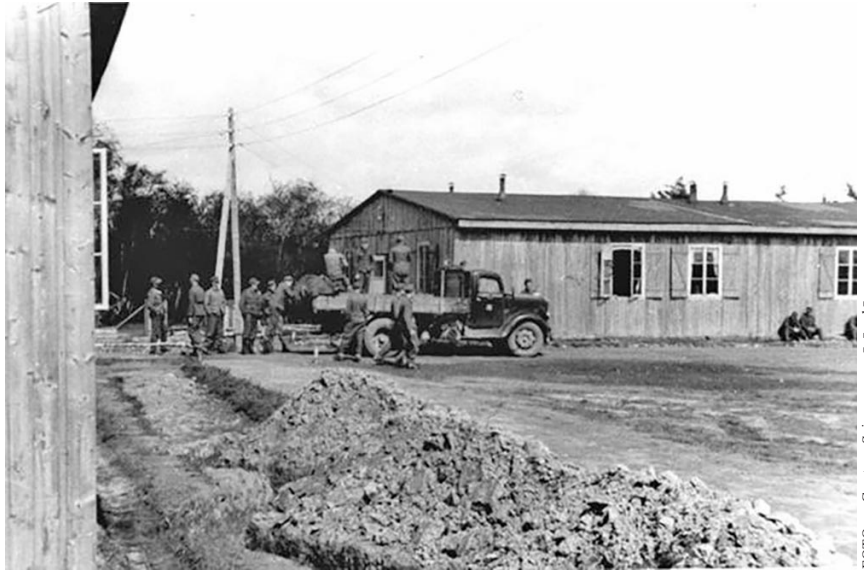
Braukšana no Korsēras uz fronti 1945. gada aprīlī.

Vēl 1943. gada martā vācieši pieļāva parlamenta ( folketing ) vēlēšanas, kas izvērtās par pilnīgu daņu nacisma sakāvi. Jūlijā ar Skavēnusa piekrišanu formēja daņu brīvprātīgo vienības ( Frikorps Danmark ) cīņām austrumu frontē. Šie daņu brīvprātīgie veidoja daļu no vāciešu SS brīvprātīgo divīzijas Ziemeļzeme ( Nordland ). Ziemeļzemes rindās cīnījās arī norvēģu un vācu izcelsmes ( Volksdeutsche ) rumāņu karavīri, kā arī kāds vads vai pusrota zviedru. Ziemeļzemei bija divi īstu ziemeļnieku pulki: „Danmark“ un „Norge“. Divīzija bija cietusi lielus zaudējumus Ļeņingradas frontē, tamdēļ bija papildināta ar daudziem