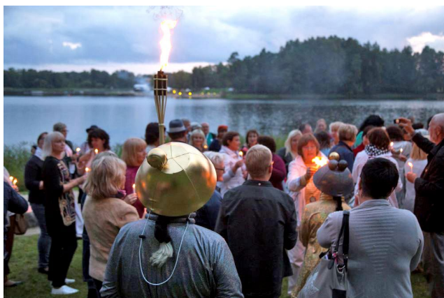
Amatierteātru sanākšana Alūksnē 2019. gadā.