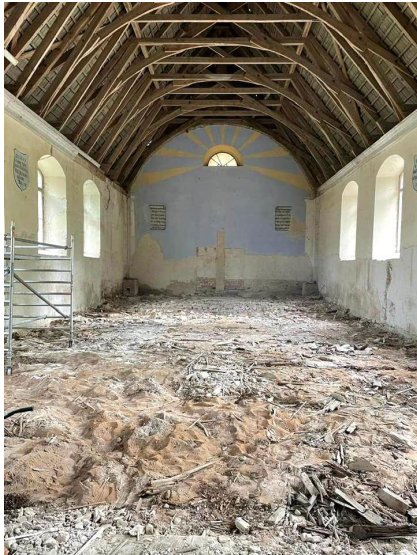
Īles baznīca 2022. gada 18. maijā.

Bija saulains vakars, kad devos uz Īli caur sarkanām, lillā un apzeltītām pļāvām, kuras iespaidīgi ierāmēja zaļie meži, kuri paši mirdzēja visvisādos zaļos toņos. Garas ēnas jau sāka pārklāt laukus, kad ieradāties pie staltas,