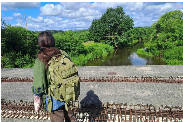
Lauma uz Zvejnieku tilta pāri Abavai.