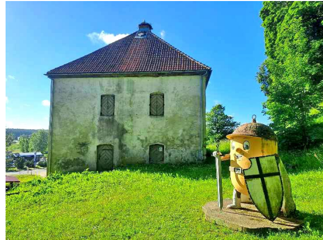
Kandavas Bruņinieku pilskalns.