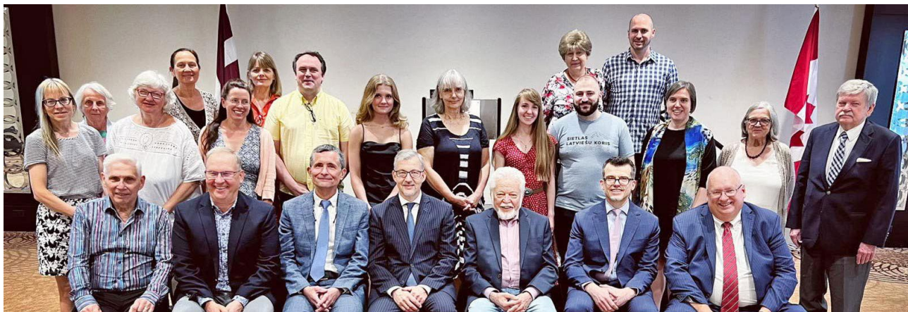
LĀZA konferences dalībnieki un viesi, Toronto, 2024. gada 4. jūlijs.