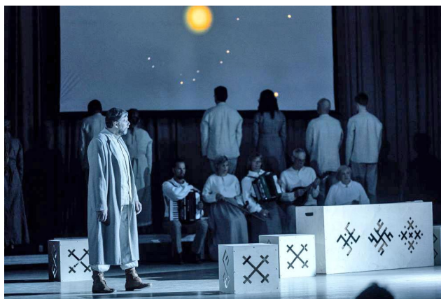
Lielvārdes Tautas teātris.