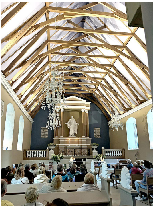
Īles baznīca 2024. gada vasarā.

baltas baznīcas. Kā gan šī ēka ir mainījies pēdējos gados! Bija reiz nolaista baznīca, kas daudz bija cietusi savā garā mūžā. Tagad tā cēli atkal gaida, kad ieradīsies ne tikai draudze, bet arī koncertu apmeklētāji. Ja agrāk lietus un vējš sagaidīja apmeklētājus baznīcas iekšpusē, tagad – jumts, jauni logi, grīdas cieši aizsargā visus, un altāris ir atkal savā vietā. Apbrīnojumi, ko gan var veikt samērā īsā laikā, kad vairāki cilvēki un organizācijas pieliek roku un uzņemas palīdzēt savest ēku kārtībā; nu labāk būtu teikt – izcilā kārtībā!